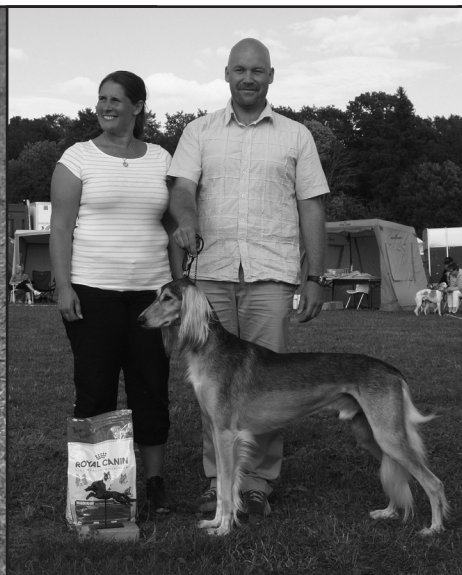
Tar emot pris för årets kombinerat 2009