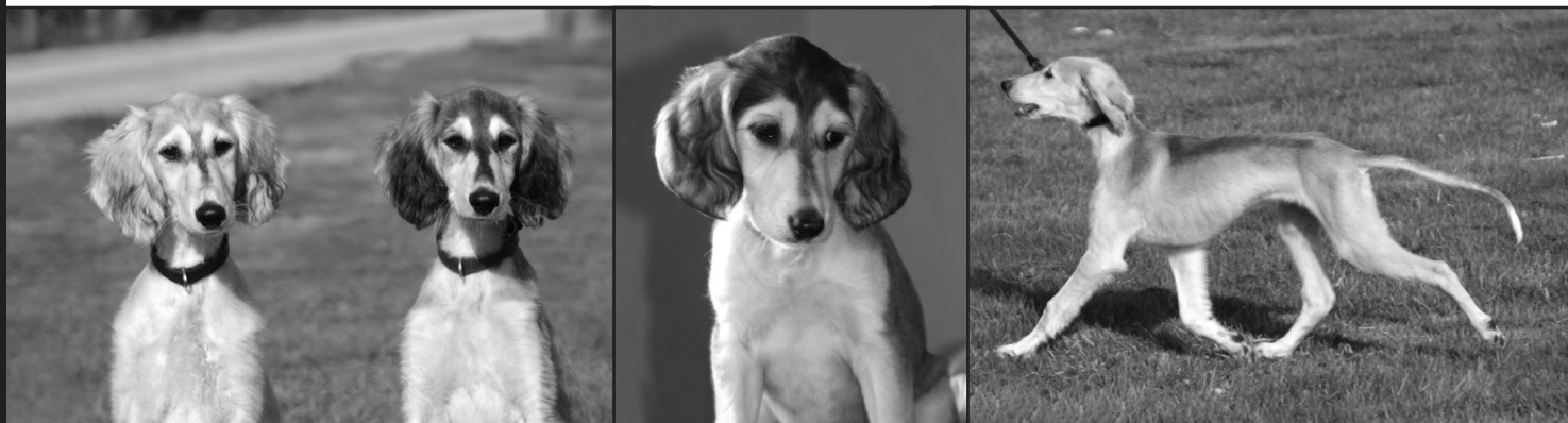
Izor och Zorro som små valpar