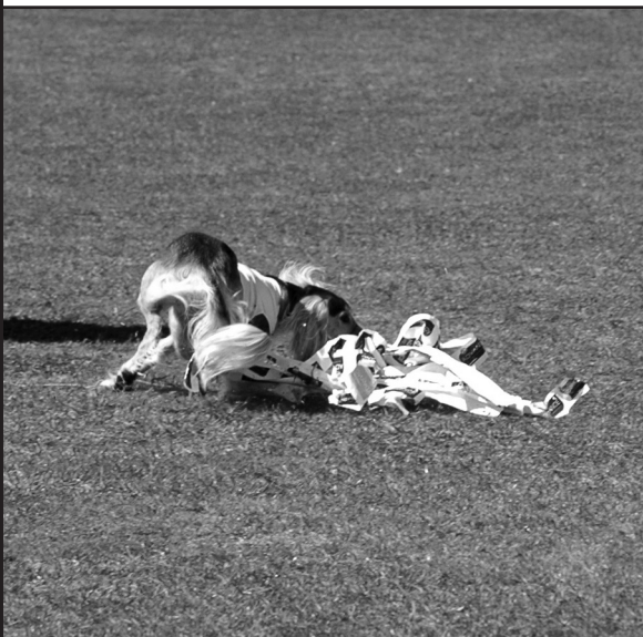
Izor visar sina färdigheter på LC fältet

Tack och lycka till vidare önskar Salukibladet!!